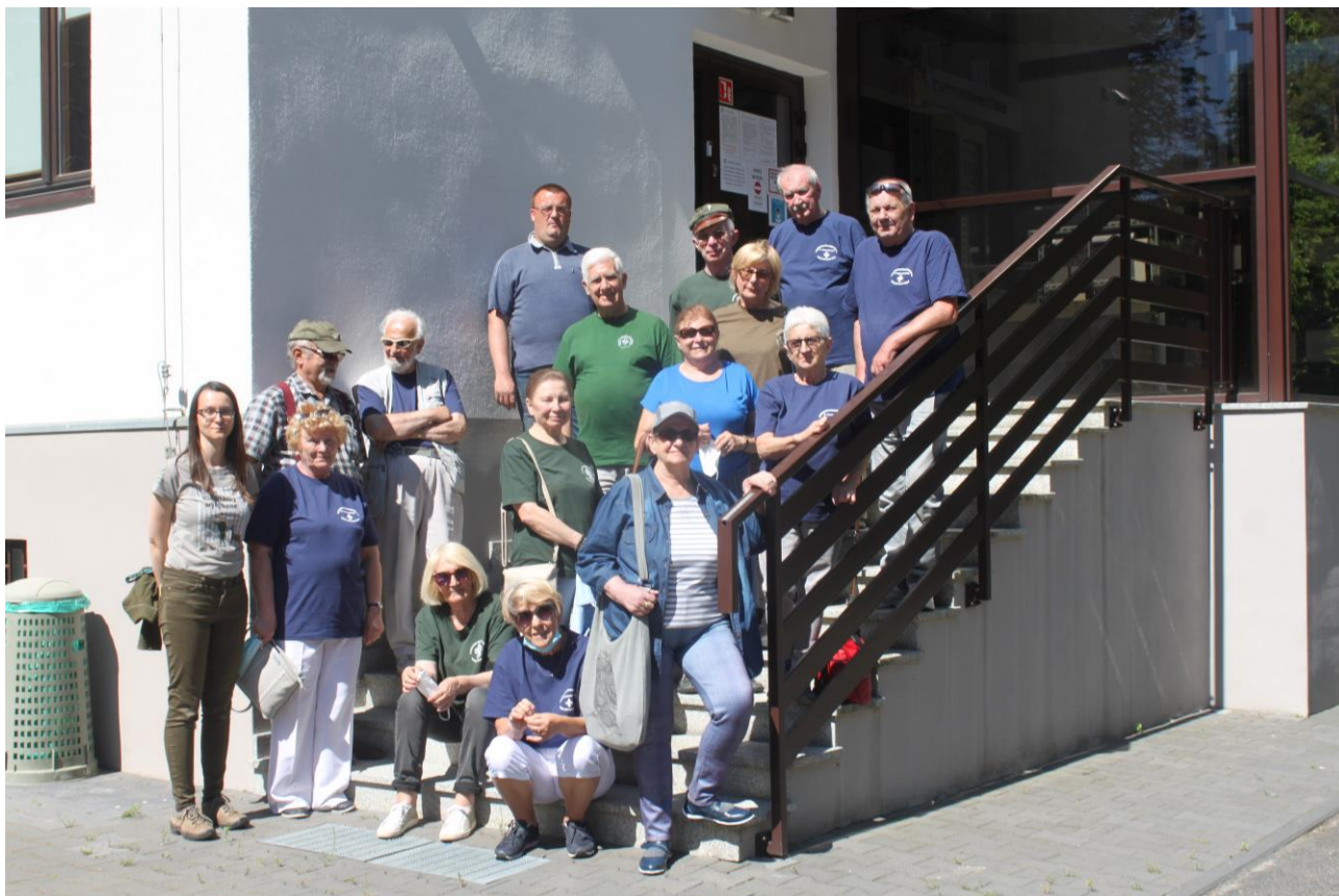
Harcerki i harcerze KSH „Szóstacy” w Nadleśnictwie Oborniki