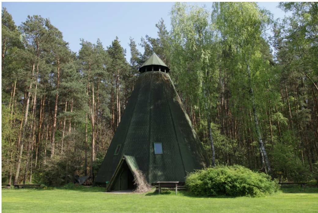
Leśny wigwam na terenie Strzelnicy Myśliwskiej w Dąbrówce Leśnej