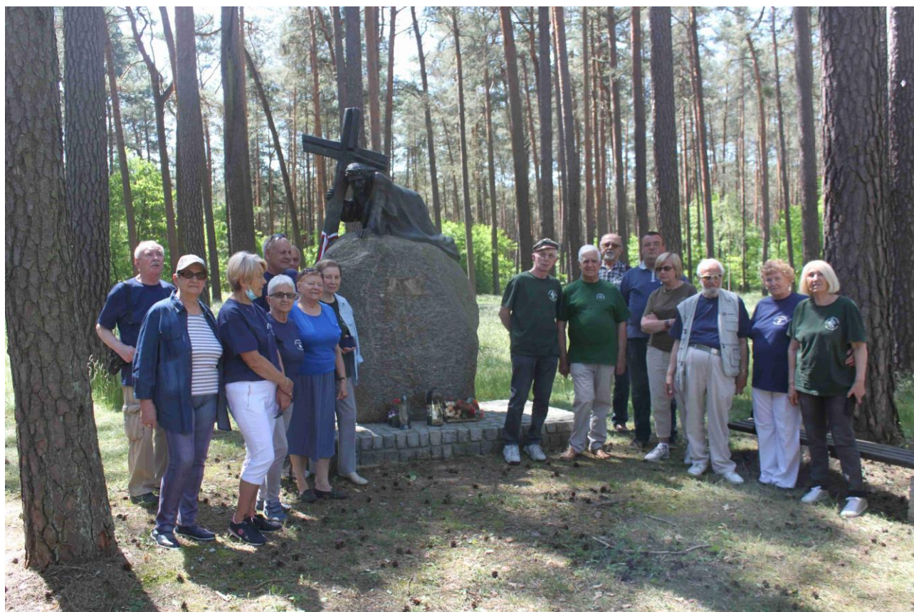
Harcerki i Harcerze KSH „Szóstacy” przy pomniku upamiętniającym zamordowanych Polaków przez niemieckich hitlerowskich okupantów