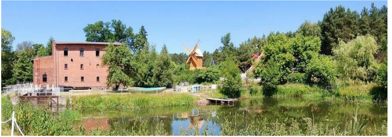
Widok ogólny Muzeum Młynarstwa w Jaraczu