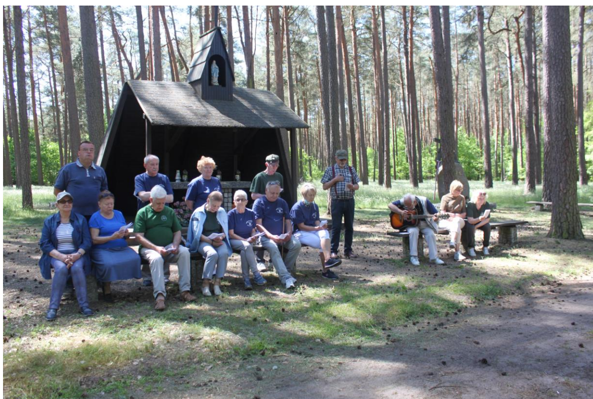
Harcerki i Harcerze KSH „Szóstacy” przed kapliczką w Lesie Rożnowickim