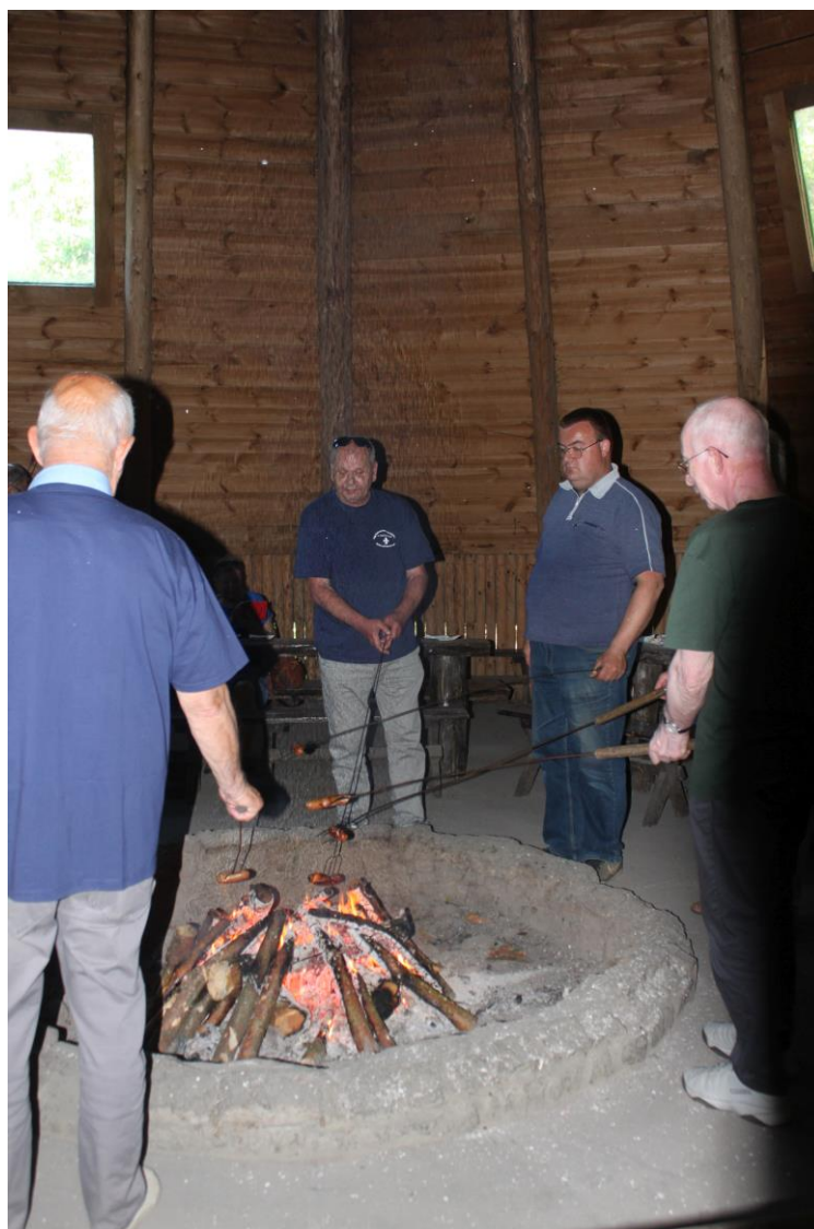
Pieczenie kiełbasek przy ognisku w wigwamie w Dąbrówce Leśnej